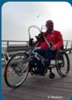
De website www.iedereenfietst.be brengt toegankelijkheid van 360 km fietsnetwerk in kaart, vertrekkend in 10 kustgemeenten.