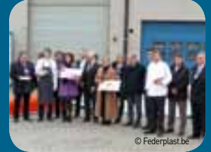
In aanwezigheid van Maria Damanaki, de Europese Commissaris voor Maritieme Zaken & Visserij, toont de kunststofindustrie haar wil om te werken aan oplossingen voor het voorkomen en verwijderen van zwerfvuil in zee.

Federplast.be, de Belgische vereniging van producenten van kunststof- en rubberartikelen, kondigt op deze dag de lancering aan van een Belgisch pilootproject voor het opvissen van drijvend afval voor de Belgische kust. Met een speciale installatie aan boord van de vissersschepen, kunnen voortaan alle soorten afval ingezameld worden. Het project werd opgezet in samenwerking met SDVO, de Vlaamse Stichting voor Duurzame Visserijontwikkeling, de Europese Waste Free Oceans Foundation en met de financiële steun van Essenscia, de Belgische Federatie van de Chemische Industrie en Life Sciences.