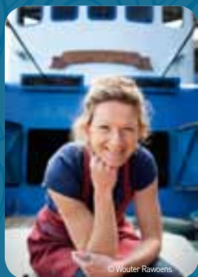
Met 'Vissersvrouwen' plaatst de provincie de vrouw achter de visser in de schijnwerper.