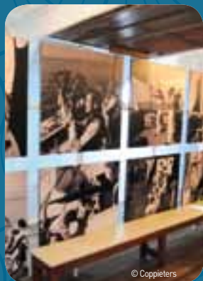
De Mercator kreeg een totaal nieuwe museale invulling.