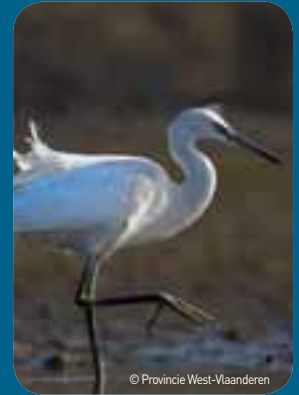
Streefdoel is opnieuw zoals in de jaren 1980 vele vogels aan te trekken, zoals deze kleine zilverreiger.