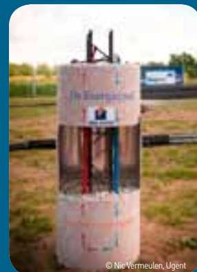
Met de eerste energiepaal wordt een belangrijke stap gezet in de verdere uitbouw van het wetenschapspark Greenbridge in Oostende.

Begin juli wordt de eerste energiepaal in de grond geboord in aanwezigheid van de rector van de Universiteit Gent Paul Van Cauwenberge, senator en minister van Staat Johan Vande Lanotte, West-Vlaams gedeputeerde Marleen Titeca-Decraene en uittredend afgevaardigd bestuurder van Greenbridge Greet Van Eetvelde. Hiermee wordt een belangrijke stap gezet in de noodzakelijke verdere uitbouw van het wetenschapspark Greenbridge op het bedrijventerrein Plassendale in Oostende. Er komt een nieuwe vleugel met kantoren en de realisatie van de Energy Box, een demonstratiefaciliteit voor nieuwe energietechnologieën zoals onder meer een zonnekoepel en zonnepanelen in de vorm van dakpannen. Het nieuwe complex zal rusten op 98 palen, waarvan 40 energiepalen van 15 meter waarbij in het beton technologie wordt aangebracht om energie uit de grond te halen. De buizen in de stalen constructie laten toe dat de aardwarmte gerecupereerd en omgezet wordt in energie. Ook grote spelers geloven in de toekomst en de mogelijkheden van Greenbridge. Daikin, Renson en Siemens tekenen een verregaande samenwerkingsovereenkomst met het wetenschapspark.