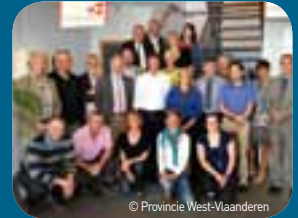
De Plaatselijke Groep As4 kent in december aan drie projecten financiële steun toe voor een totaal van 617.876,33 euro aan Europese, Vlaamse en Provinciale middelen ( www.west-vlaanderen.be/evf ).

Met 'Cool! Ik voel!' wil promotor Nationaal Visserijmuseum Oostduinkerke (NAVIGO) de bezoeker op een interactieve manier laten kennismaken met de soorten die in het Belgische deel van de Noordzee voorkomen. Gekoppeld aan een voelaquarium, zullen actieve 'visserijlessen' georganiseerd worden onder leiding van echte vissers.