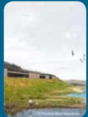
Het kijkcentrum is in de dijk ingewerkt en biedt panoramisch zicht op de Zwinvlakte.