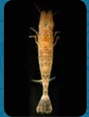
De levende garnalen worden tijdens een laatste sleep gevangen, korte tijd voor het vaartuig aanmeert.

Previs, het zelfstandig orgaan binnen het Zeevissersfonds dat zich bezig houdt met de veiligheid op Belgische vissersvaartuigen, introduceert in maart samen met de Rederscentrale het Man Overboord systeem (MOB). Dat bestaat uit een zender die elk bemanningslid steeds bij zich moet dragen. Als iemand overboord gaat, wordt het signaal opgevangen door een ontvanger in de stuurhut en indien nodig door zoekende helikopters. Het initiatief wordt gefinancierd met provinciale, Vlaamse en Europese middelen.