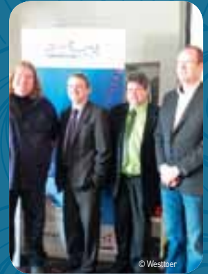
Westtoer lanceert het concept 'Belgian Coast Greeters', vrijwilligers die hun eigen badplaats promoten bij toeristen.