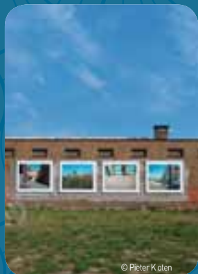
De tweede editie van het kunstenfestival Freestate brengt kunst op unieke locaties in Oostende.

'We stellen niet alleen jonge artiesten voor, maar brengen eveneens een stuk onbekend Oostende onder de aandacht'.