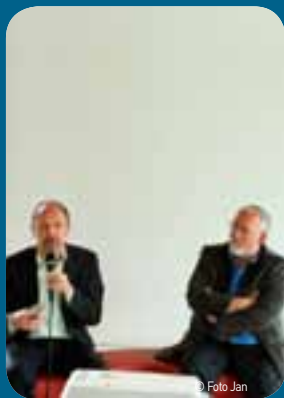
Een boodschap van Johan Vande Lanotte voor het Coördinatiepunt Duurzaam Kustbeheer: 'Het Coördinatiepunt moet haar grenzen verleggen door samenwerking met buurlanden uit te bouwen.'

'Een BAK, Bestuursakkoord Kust, zou ons een heel stuk verder brengen.'