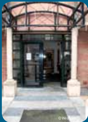
Uit een onderzoek van Westkans blijkt dat slechts 8,6 procent van de restaurants en cafés aan de kust voldoende toegankelijk zijn.