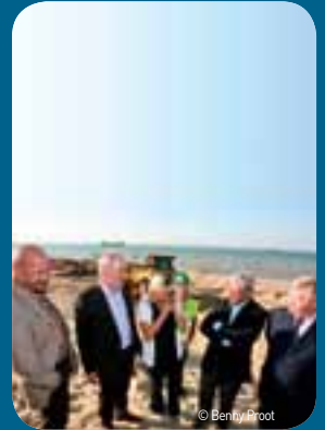
Minister Crevits geeft in oktober in Koksijde het officiële startsein voor de uitvoering van het Geïntegreerd Kustveiligheidsplan.

In 2011 is al heel wat geïnvesteerd in werken die dringend nodig zijn zoals het Openbare Werken Plan in Oostende. Het groeistrand werd met zand hervoed en de werken voor de heraanleg van het Zeeheldenplein zijn van start gegaan. Dat plein wordt verbreed en krijgt een golfdempende uitbouw. De beschermingswerken door de verbreding van de stranden in Koksijde en De Panne werden gerealiseerd. De verbreding van het strand in De Haan (Wenduine) en het hervoeden van de stranden in Duinbergen en Koksijde zijn opgestart. Opvallend is dat er in Bredene geen maatregelen nodig zijn. Daar zullen de hoge duinen voor voldoende bescherming tegen de 1.000-jarige storm zorgen.