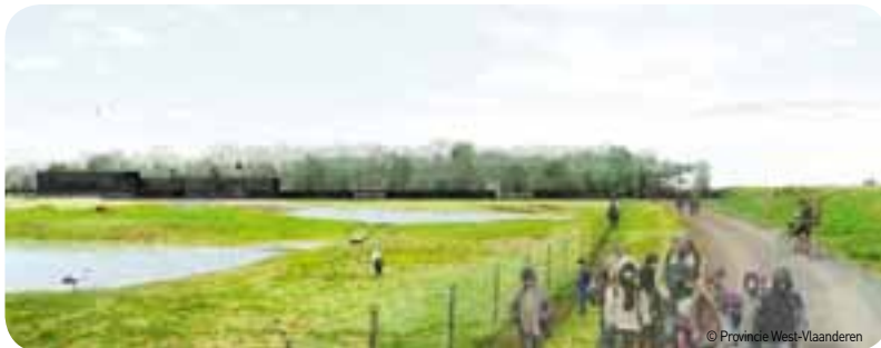
In februari wordt het winnende wedstrijdontwerp voor het nieuwe eigentijdse 'Natuureducatief Ecotoeristische Zwin', het Zwin Natuurcentrum voorgesteld.

Het gekozen ontwerp vormt de basis voor verdere besprekingen. In 2012 wordt het voorontwerp opgemaakt en goedgekeurd, op basis waarvan de uitvoering zal plaatsvinden tijdens de daaropvolgende jaren.