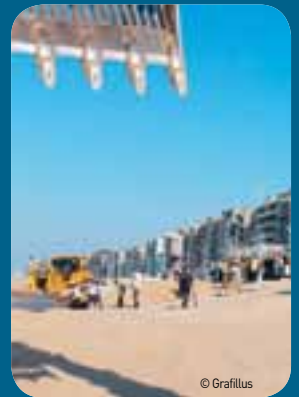
Op ongeveer één derde van de kustlijn zijn ingrepen nodig.