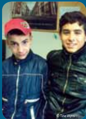
Aan de Belgische kust vertoeven volgens ruwe schatting een 600 tot 800-tal illegalen.