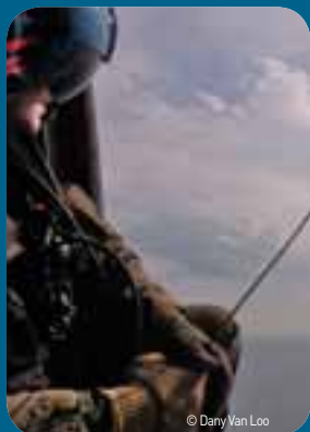
De Seakings krijgen in 2011 een record aantal oproepen.

'Als er onzekerheid is over het feit dat een vermiste persoon zich in zee of op het land bevindt, zetten we beide procedures in gang.'