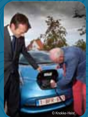
Knokke-Heist wil elektrische voertuigen in de badstad promoten en sluit een overeenkomst voor de aanleg van oplaadpunten in de stad.