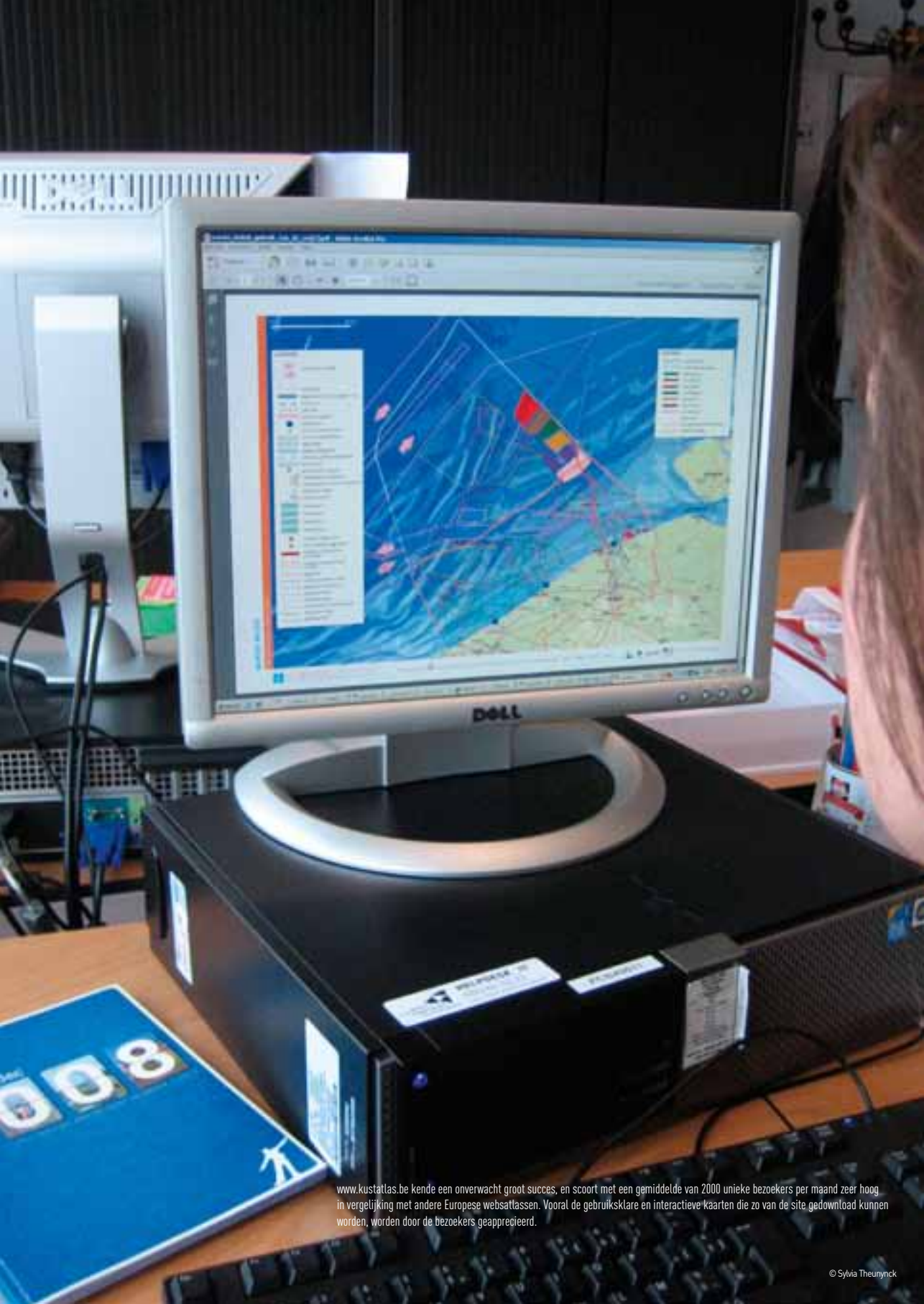
www.kustatlas.be kende een onverwacht groot succes, en scoort met een gemiddelde van 2000 unieke bezoekers per maand zeer hoog in vergelijking met andere Europese websatlassen. Vooral de gebruiksklare en interactieve kaarten die zo van de site gedownload kunnen worden, worden door de bezoekers geapprecieerd.