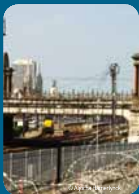
Illegale vluchtelingen die de treinsporen proberen over te steken leggen in januari en februari regelmatig het treinverkeer stil.