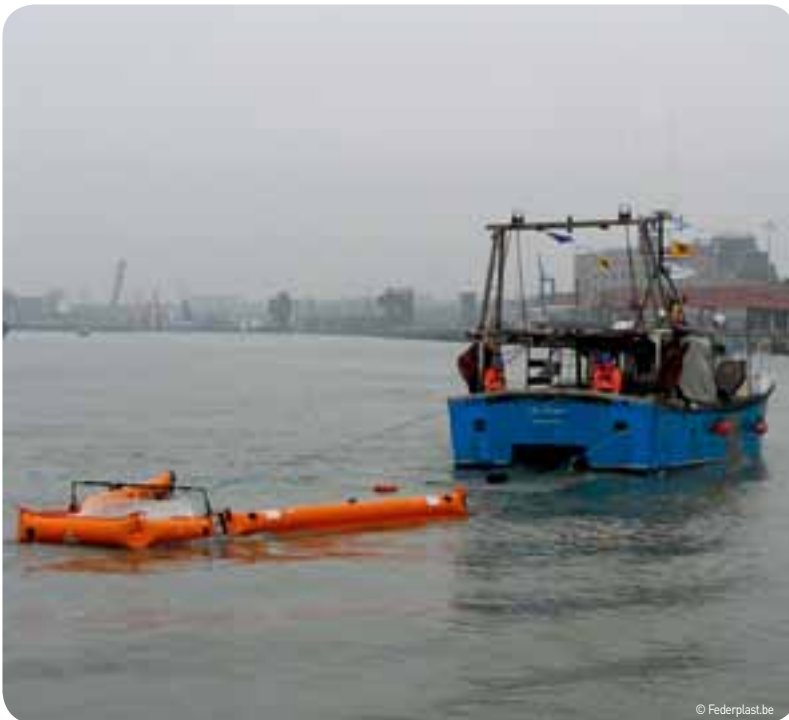
Met een speciale installatie aan boord van de vissersschepen kunnen voortaan alle soorten drijvend afval ingezameld worden.